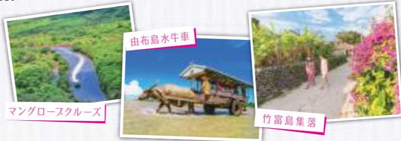
マングローブスルーズ

※追加オプションは、ご予約時にご選択ください。※出発後のスラン変更はできません。 ※バス観光を選択した場合の最少催行人員は、2名以上となります。