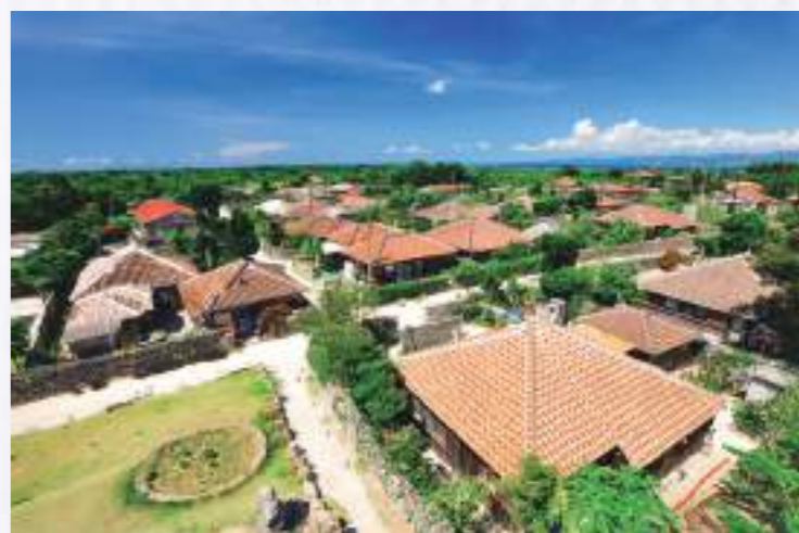
※掲載写真は全てイメージです。

出発時間 : 石垣発 8:30~15:00(定期便に準じる) ※復路はお好きな定期便利用可(但し最終便のみ利用不可) ※下車・乗車地と時間の事前予約が必要